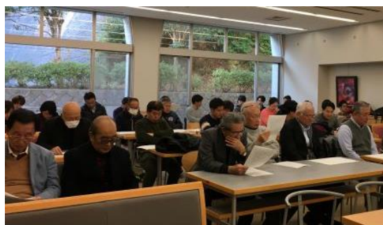
熱心に聞き入る総会出席者

◎ 上記以外の写真を八景会ホームページ「会員ログインページ(パスワード: hakkeikai60)」に多数掲載しています。ぜひご覧ください。